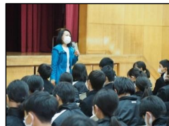
逢楽さんの講演会の様子

から始まった講演会では、スマホの使い方やインターネット上の情報の不確かさ、SNSを使った投稿の危険性など、多岐にわたって生徒たちに示唆をいただきました。ご家庭でも、使い方などをお子さんと一緒に考える機会にしていただけたらと思います。(裏面に講演会の内容について載せています。ぜひ、ご覧ください。)