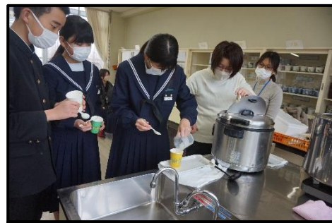
お豆腐づくりを体験！（食品講座）

さて、今年度から愛知県の高校入試制度が大きく変わりました。三年生は1月中旬から受験が始まっている生徒もおり、例年より2週間程度試験が早くなっています。一年生にとっては2年後のことです。あっという間に自分の進路について考えるときがやってきます。総合的な学習の時間に、進路に関連したキャリア教育を継続して行ってきました。一年生は、自分を見つめ自分のよさを発見することと、様々な職業について調べて必要な力を知ることや職業に就くまでの見通しをもつことを学習してきました。そして、一年生のキャリア教育の集大成として1月27日に「職業セミナー」を開催しました。多種多様(14講座)な仕事をされている講師の方々にお越しいただきました。生徒たちは、働くことの意義を聞いたり、仕事に関する体験活動をしたりしました。イラストレーター講座の講師の方は「誰のために行っている仕事か」「何のために行っている仕事か」を意識することが必要だというお話をされました。その後、「〇〇〇さんを買ってもらえるようなLINEスタンプを描いてみよう」というテーマで、イラストレーターのお仕事の一部を体験すると共に、他者意識をもって仕事を進めることの大切さを学ぶことができました。自分のキャリアを考える上で、職業セミナーが貴重な場になったことと思います。2年後の自分の進路を見据えて、ご家庭でもぜひ話題にさせていただけたらと思います。