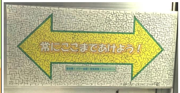
窓枠用の掲示物もデザインが光りました！