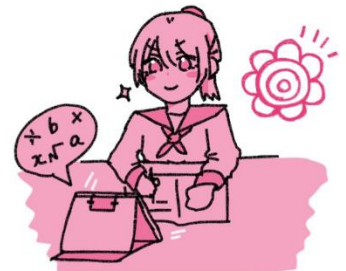
イラスト作成： 保健委員 中島つばささん

まずは自分のメディア使用時間や使用状況を見直してみませんか。また、メディア使用時のルールが決まっていないと、だらだらと使い続けてしまうそうです。今一度、メディア使用時のルールを決めたり見直したりしてみましょう。